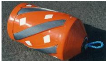
Gambar 1. Foam Pig

Foam pig berfungsi sebagai pembersih awal pada konstruksi yang baru selesai dikerjakan dengan tujuan uji coba untuk melihat kemulusan kondisi instalasi pipa bagian dalam. Foam pig termasuk pig yang lunak sehingga apabila didalam instalasi terjadi hambatan dan diberikan tekanan tambahan pig akan robek selanjutnya hancur. Pig ini umumnya dibuat dari foam sesuai dengan namanya dan berbentuk silinder dan bagian depan dibuat tirus untuk memudahkan peluncuran dan terlepas dari kemacetan.