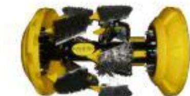
Gambar 4. Scraper Pig

Pig jenis ini berfungsi untuk mengikis kotoran agak keras pada dinding bagian dalam namun setelah dilakukan pigging dengan foam pig , brushes pig atau tipe lain yang secara meyakinkan telah tidak terjadi kemacetan. Kepala dan ujung akhir atau kadang-kadang ditengah pig ini dipasang seal perapat dari bahan yang elastik tapi cukup kuat menahan tekanan dan gesekan. Perlengkapan lain seperti roda gigi terdapat di sekeliling badan pig dengan tumpuan pegas sehingga saat meluncur roda ini dapat menyesuaikan terhdap perubahan-perubahan diameter pipa. Disamping roda gigi juga pada badan pig dilengkapi dengan pisau-pisau pengikis pada arah melingkar dan membentuk spiral sehingga dimaksudkan sewaktu pig meluncur sambil berputar mengikis kerak-kerak sekeliling pipa.