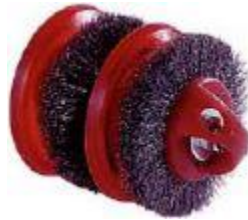
Gambar 5. Brushes Pig

Pig tipe ini banyak digunakan untuk pembersih pipa minyak yang telah beroperasi sebagai pembersih kotoran-kotoran lunak, kerak korosi atau partikel-partikel halus. Dengan bentuk kepala yang tirus akan mudah lepas dari kemacetan dan lebih cocok untuk pigging berkala sehingga kotoran tidak sempat mengeras. Karena di ujung kepala ada moncong elip yang berlubang sehingga sewaktu pig meluncur terjadi aliran turbulensi yang dapat mengakumulasi kotoran berada di depan pig dan dapat terbawa keluar.