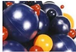
Gambar 3. Unisphere pig

Pig ini berfungsi untuk membersihkan kotoran-kotoran halus, air kondensat atau keperluan yang serupa. Bahan pig dibuat dari material lunak seperti polyethelene atau bahan lain yang sesuai. Konstruksi pig tidak memakai pelipit dan dibalut dengan cairan oleh karena bentuknya maka lebih cocok digunakan pada konstruksi pipa yang berkelok-kelok pada belokan-belokan yang radiusnya relatif kecil.