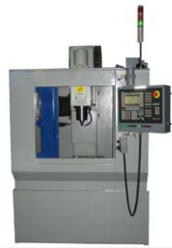
Gambar 1 Prototipe Mesin Freis Vertikal

Konstruksi dari mesin perkakas ini menggunakan material baja konstruksi SS400 yang dilas dan dilengkapi dengan perangkat with automatic tools changing (ATC).