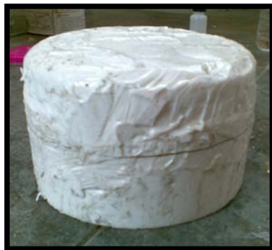
Gambar 9. cetakan yang telah disatukan