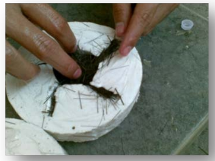
Gambar 6. Ijuk disusun pada cetakan