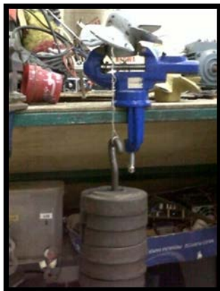
Gambar 3. Set up pengujian beban sudu turbin