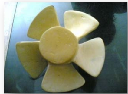
Gambar 12 Sudu setelah didempul dan diampas