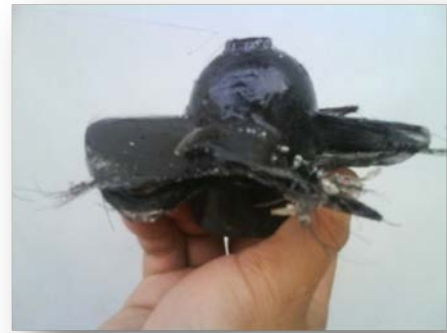
Gambar 11. sudu yang baru dilepas dari cetakan