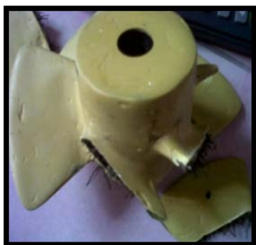
Gambar 4. Sudu setelah mengalami pengujian