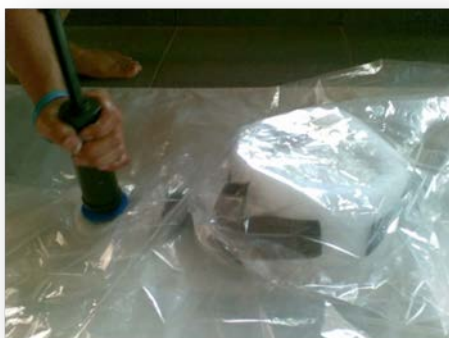
Gambar 10. proses vacuum bag

Setelah sudu selesai dibuat, berikutnya adalah menguji sudu. Pengujian pertama adalah pengujian kinerja sudu, dan yang kedua adalah pengujian kekuatan sudu.