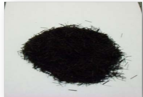
Gambar 3. serat ijuk yang telah di pilih