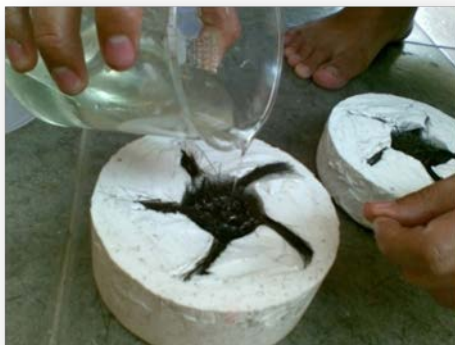
Gambar 8. Resin yang dituangkan kedalam cetakan