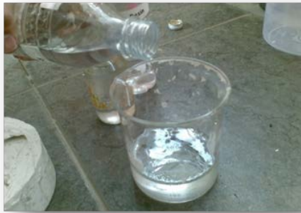
Gambar 7. Resin dan katalis dicampur