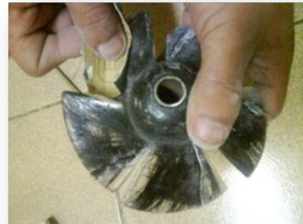
Gambar 12 Permukaan sudu diampas untuk meratakan permukaan sebelum didempul