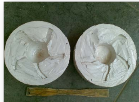
Gambar 5. cetakan yang telah di lapisi dengan white oil