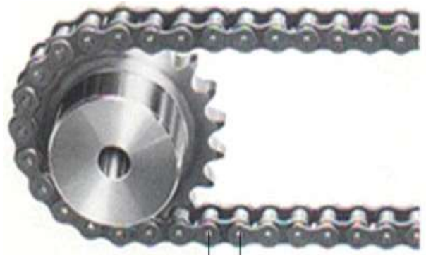
Gambar 7. Sproket

Sproket merupakan elemen mesin yang berfungsi untuk mentransmisikan daya dan putaran dari suatu poros ke poros yang lain dengan rasio kecepatan yang konstan dan memiliki efisiensi yang tinggi. Untuk itu dibutuhkan ketelitian yang tinggi dalam pembuatan, pemasangan dan pemeliharaan (Sularso, 1997).