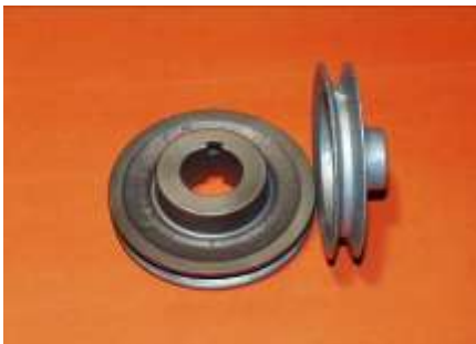
Gambar 5. Pulley ( http://www.four-h.purdue.com )

PulleyV-bel merupakan salah satu elemen mesin yang berfungsi untuk mentransmisikan daya seperti halnya sproket rantai dan roda gigi. Bentuk pulley adalah bulat dengan ketebalan tertentu, di tengah-tengah pulley terdapat lubang poros. Pulley pada umumnya dibuat dari besi cor kelabu FC 20 atau FC 30, dan ada pula yang terbuat dari baja (Sularso, 1997):