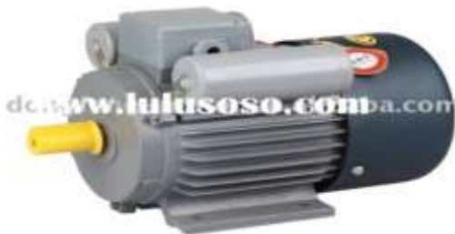
Gambar 4. Elektro motor1 phase

Motor listrik satu phase sering digunakan sebagai penggerak pada peralatan yang memerlukan daya rendah dan kecepatan yang relatif konstan. Hal ini disebabkan karena motor induksi satu phase memiliki beberapa kelebihan yaitu konstruksi yang cukup sederhana, kecepatan putar yang hampir konstan terhadap perubahan beban dan umumnya digunakan pada sumber satu phase yang banyak terdapat pada peralatan domestic (Zuhal,1977).