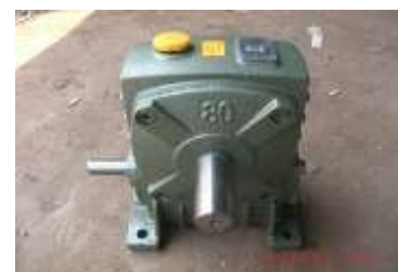
Gambar 3. Gigi reduksi

Gigi reduksi berfungsi sebagai mereduksi putaran yang akan terjadi pada silinder. Gigi reduksi ini memakai oli sebagai pelumas. Peran gigi reduksi adalah menggantikan pulley .