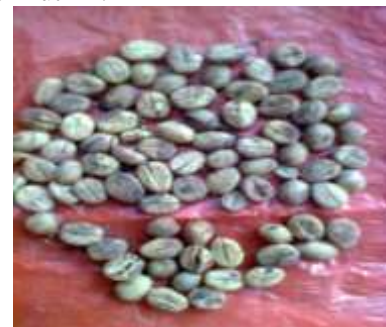
Gambar 14. Hasil biji kopi terkupas dengan baik

Dalam hal ini, mekanisme pengupasan kulit biji kopi basah memakai sudut yang bervariasi yaitu 30^0, 45^0 dan 60^0 dengan jarak 5,7 dan 9 mm. Hasil pengupasan sebagai berikut ini: