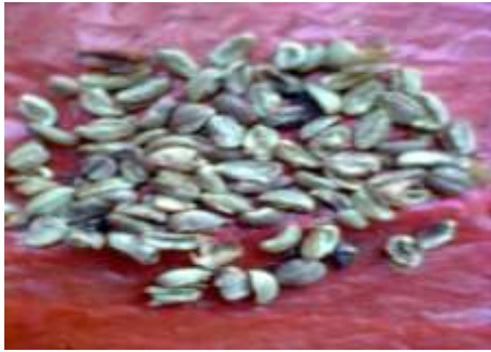
Gambar 15. Hasil biji kopi pecah

Hasil pengupasan berdasarkan sudut silinder pengupas dapat dilihat pada tabel berikut :