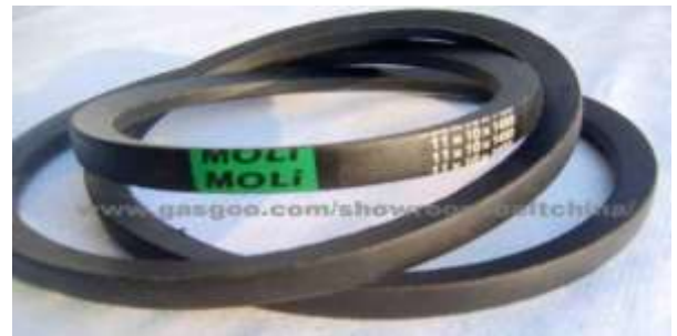
Gambar 6. V-belt

V-belt memiliki keunggulan lain dimana V-belt akan menghasilkan transmisi daya yang besar pada tegangan yang relatif rendah serta jika dibandingkan dengan transmisi roda gigi dan rantai, V-belt bekerja lebih halus dan tak bersuara (Sularso, 1997).