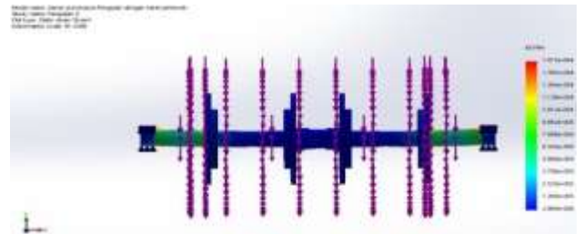
Gambar 12. Nilai straint

Nilai Straint yang diperoleh pada hasil simulasi sebesar 0,013.