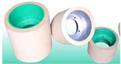
Gambar 2. Rol karet

Umumnya alat - alat yang dibuat dari karet alam sangat berguna bagi kehidupan sehari-hari maupun dalam usaha industri seperti mesin penggerak. Barang yang dapat dibuat dari karet alam antara lain aneka ban kendaraan (dari sepeda, motor, mobil, traktor hingga pesawat terbang), sepatu karet, sabuk penggerak mesin besar dan mesin kecil, pipa karet, kabel, isolator dan bahan-bahan pembungkus logam seperti rol karet (Nazaruddin dan Paimin, 1999). Penggunaan karet alam karena dengan melihat mesin perkakas yang akan dibuat. Apabila mesin perkakas tersebut tidak melibatkan suhu yang tinggi, maka karet alam sudah cukup baik dalam penggunaan.