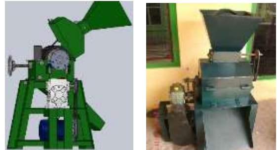
Gambar 13. Hasil Rancangan