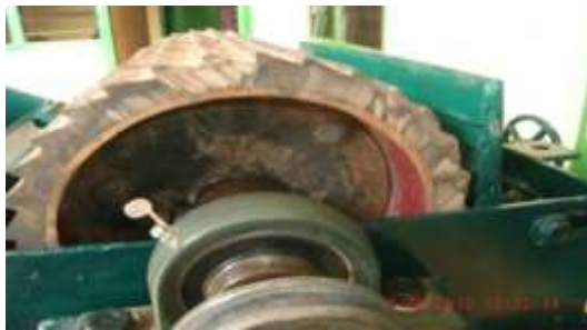
Gambar 8. Mekanisme pengupasan