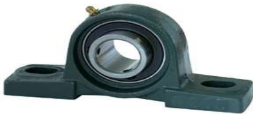
Gambar 1. Pillow block ( http://www.vxb.com )

Bantalan ( pillow block/bearing ) merupakan elemen mesin yang mampu menumpu poros berbeban, sehingga putaran atau gerakan bolak - baliknya dapat berlangsung secara halus, aman, dan panjang umur (Sularso, 1997:103). Bantalan harus cukup kokoh untuk memungkinkan poros serta elemen mesin lainnya bekerja dengan baik. Pemasangan bantalan poros diantara poros dan dudukan bertujuan untuk memperlancar putaran poros, mengurangi gesekan dan mengurangi panas serta menambah ketahanan poros. Syarat bantalan poros harus presisi ukuran sehingga tidak kocak dalam bekerja.