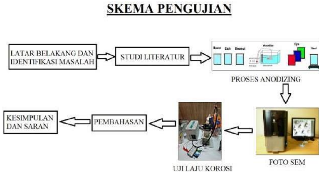
GAMBAR 1 Skema Pengujian