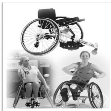
Gambar 2. Sport wheelchair ( http://www.apparelyzed.com/wheelchair/ )

Kursi roda ini ringan dan didesain untuk memindahkan pusat gaya berat untuk memperoleh pergerakan dan stabilitas yang lebih besar daripada manual wheelchair atau power wheelchair . Kursi ini dirancang khusus untuk para atlet. Beberapa kursi dirancang untuk olahraga khusus seperti basket atau balap mobil dan yang lainnya digunakan untuk olahraga secara umum. Keistimewaan kursi roda ini adalah memiliki roda yang lebih besar daripada manual wheelchair , handrim yang kecil, sloping propelling wheels , lebih tahan lama dan efficient bearing and hubs , posisi roda yang mudah bergerak dan steerable casters .