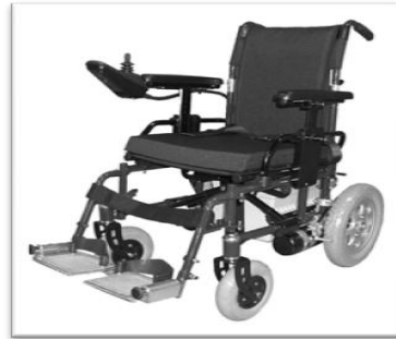
Gambar 3. Power wheelchair