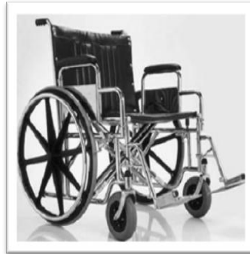
Gambar 1. Manual wheelchair

lainnya terdiri dari roda kecil dengan diameter 5 atau 8 inci. Desain ini membuat kursi roda stabil dan mudah untuk bergerak maju maupun mundur. Kebanyakan manual wheelchair ringan dan dapat dilipat untuk transportasi mobil.