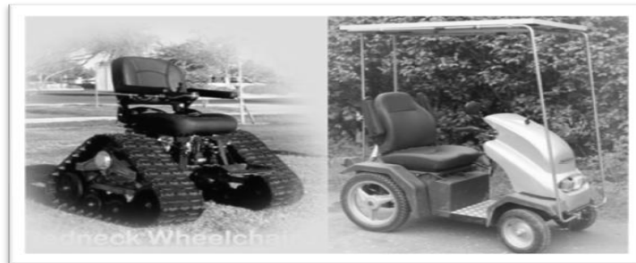
Gambar 4. power alternatives wheelchair ( http://www.treehugger.com/ )

Kursi roda ini bersifat seperti kursi yang dilengkapi dengan motor akan tetapi tidak tampak seperti tipe kursi roda. Kebanyakan model ini mempunyai tiga roda dan menyerupai kereta golf atau motor scooter . Beberapa kursi roda jenis ini dapat digunakan pada tanah yang lapang di mana kursi roda jenis lainnya tidak dapat digunakan. Power alternatives yang kecil memberikan pergerakan yang lebih besar untuk melalui pintu yang sempit dan sudut tikungan. Harga kursi roda bervariasi antara satu dengan yang lainnya. Harga tergantung dari tipe kursi roda ( manual, power, sports atau power alternatives ), jumlah aksesoris dan keistimewaannya, kualitas bahan dan materialnya, dan perusahaan pembuatnya.