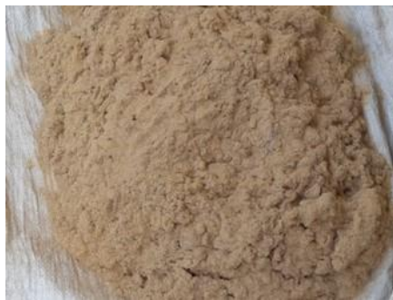
Gambar 2. Partikel Serat Pinang

Ketersediaan alat uji laboratorium dalam pelaksanaan penelitian sangat dibutuhkan. Sampel uji briket yang diambil dan dipersiapkan untuk dilakukan pengujian dengan menggunakan alat "Bomb Calorimeter" model OXY-360 (Gambar 3). Perlakuan dan seleksi sampel uji karakteristik difokuskan pada pengukuran energi panas pembakaran atau nilai kalor ( calorific value ).