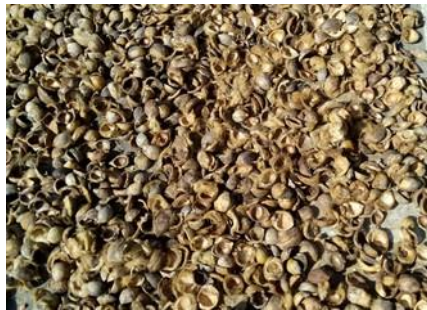
Gambar 1. Serat buah Pinang

Hasil pencacahan tersebut digiling menggunakan mesin disk mill untuk dijadikan partikel atau butiran ( mesh ) berukuran \pm 0,3 sampai 0,6 mm (Gambar 2). Langkah berikutnya mencetak briket dengan mencampurkan butiran serat pinang dan tapioka. Pada pencetakan briket ini, diberi tekanan kompaksi secara manual sebesar 100 \text{ kgf/cm}^2 melalui alat pencetak briket. Variasi perbandingan konsentrasi serat pinang sebesar 90%, 80%, 70%, dan 60%. Briket yang telah dicetak kemudian dipanaskan pada temperatur 120^\circ\text{C} menggunakan oven selama 1 jam. Setelah itu dikeluarkan dan dijemur pada sinar matahari dalam beberapa hari sampai kadar air rendah. Briket yang sudah kering, diambil sampel ujinya untuk kegiatan pengujian nilai kalor di laboratorium. Sampel uji masing-masing variasi konsentrasi dengan 5 sampel dilakukan uji karakteristiknya.