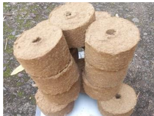
Gambar 4. Briket Serat Pinang

Pada penelitian ini, dipersiapkan serat pinang sesuai kebutuhan untuk pembuatan briket. Kebutuhan bahan baku penelitian dikalkulasi dengan memprediksi terhadap banyaknya jumlah variasi perbandingan konsentrasi serat pinang dengan perekat yang digunakan. Sesuai alur pemikiran teknis pembuatan briket sehingga diperoleh model fisis produk briket hasil pengembangan (Gambar 4).