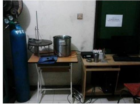
Gambar 3. Alat Bomb Calorimeter

Dalam analisis dari tiap jenis dan komposisi bahan campuran serta parameter perlakuan akan dicatat dan ditabulasikan pada tabel yang dirancang sesuai kebutuhan. Menurut standard ASTM D5865 [9] nilai kalor ditentukan dalam uji standard bomb kalorimeter.