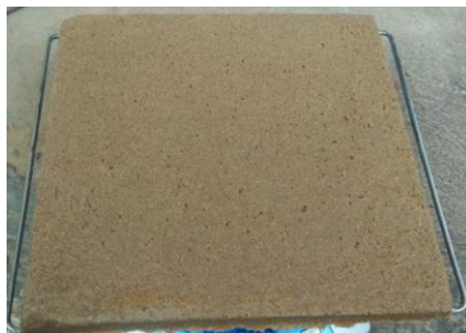
Gambar 4. Papan Partikel yang dihasilkan

60%. Partikel buah pinang pinang dan tapioka dicampurkan dalam wadah yang selanjutnya diaduk dengan penambahan air \pm 250 ml. Pengadukan campuran dilakukan secara manual sampai merata. Kemudian campuran tersebut dipindahkan ke cetakan yang berukuran 250mm x 250mm x 12mm yang terlebih dahulu dilapisi aluminium foil. Proses pencetakan selanjutnya dikempa dengan tekanan 100kg/cm 2 dengan waktu penahanan selama 60 menit sehingga mendapatkan model papan partikel untuk perabotan ( furniture interior ). Pelepasan hasil cetakan dilanjutkan dengan memanaskan papan partikel pada oven pemanas pada temperatur 120°C selama 60 menit. Papan partikel yang sudah selesai dipanaskan, dilanjutkan proses pengeringan dengan dijemur mengenai pada sinar matahari selama 4 hari, yang dapat dilihat pada Gambar 4.