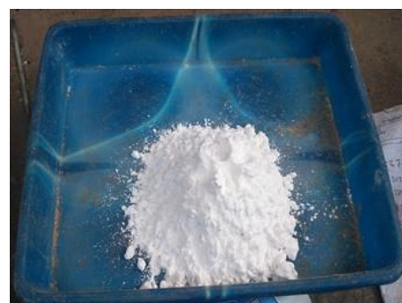
Gambar 3. Tepung Tapioka

Pada pembuatan papan partikel, perekat yang digunakan tepung tapioka (Gambar 3). Penggunaan variasi perbandingan fraksi volume partikel buah pinang dengan konsentrasi 90%, 80%, 70%, dan