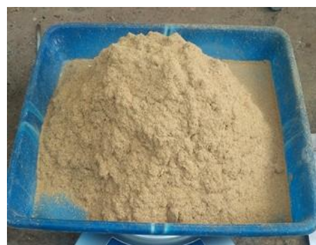
Gambar 2. Partikel Pinang