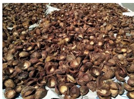
Gambar 1. Kulit buah Pinang

Metode pelaksanaan pembuatan papan partikel diawali dengan mempersiapkan limbah kulit buah pinang (Gambar 1) yang sudah kering. Kulit pinang selanjutnya dicacah dan dijadikan partikel atau butiran ( mesh ) berukuran \pm 0.6 mm menggunakan mesin disk mill, yang dapat dilihat pada Gambar 2.