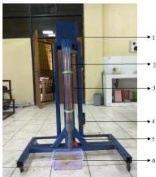
Gambar 2. Hasil rancangan alat uji viskometer sistem bola jatuh