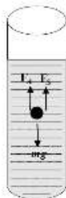
Gambar 1. Gaya-gaya pada bola di dalam fluida (Anwar, 2008)

Dengan memasukkan rumusan gaya apung ( F_A ) rumusan gaya gesekan ( F_S ) menggunakan hukum Stokes dan juga memasukkan nilai berat ( W ) bola maka akan didapat formula viskositas fluida sebagai berikut ini: